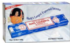
heerlijke zuivere wierook en meer!

2013: het eerste be-LEEF! evenement is een feit. De Navonne Shop is online op facebook en tijdens ShopMomenten zijn veel bekende en nieuwe producten van 'toen' weer verkrijgbaar.